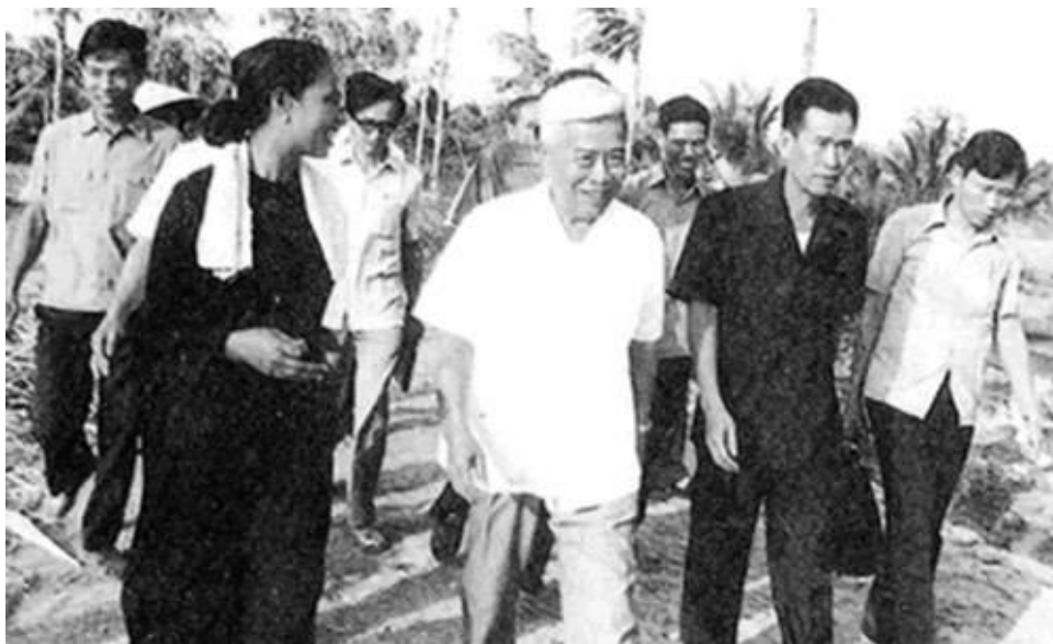
Đ/c Phạm Hùng thăm và làm việc với trại cải tạo K20 Bến Tre (Năm 1982)

Đồng chí Phạm Hùng sinh ra ở một vùng đất Nam bộ giàu truyền thống yêu nước, căm thù giặc sâu sắc. Đồng chí tham gia hoạt động cách mạng trong tổ chức Việt Nam Thanh niên Cách mạng tại Mỹ Tho khi 16 tuổi; vinh dự được kết nạp vào Đảng, làm Bí thư chi bộ trường học khi 18 tuổi; được Đảng phân công làm Bí thư Tỉnh ủy Mỹ Tho khi 19 tuổi. Khi đang tích cực lãnh đạo nhân dân đấu tranh chống thực dân Pháp và chế độ phong kiến, ngày 2/6/1931, Đồng chí bị thực dân Pháp bắt tại Mỹ Tho. Kẻ thù đã dùng mọi thủ đoạn thâm độc, mọi cực hình để tra tấn nhưng không khuất phục được ý chí cách mạng của Đồng chí, sau hơn 7 tháng