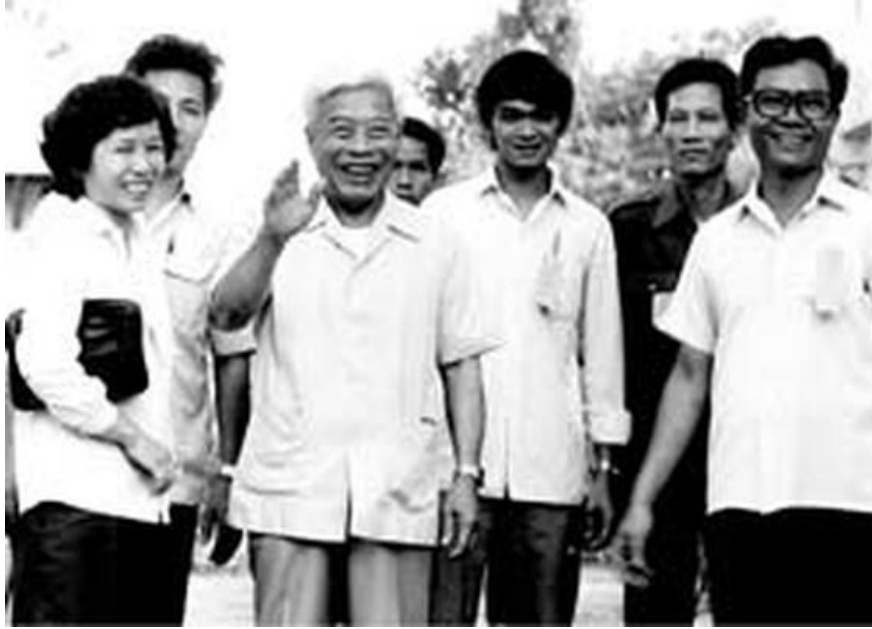
Đồng chí Phạm Hùng (thứ ba từ trái sang) với bà con phường 9, quận 3, TPHCM tháng 4 năm 1987

Tình hình đất nước ta trong những năm đầu đổi mới gặp vô vàn khó khăn, khủng hoảng, lạm phát nghiêm trọng, các thế lực thù địch thực hiện cấm vận bao vây, phá hoại nhiều mặt, hòng làm đất nước ta kiệt quệ về kinh tế. Trên cương vị đứng đầu Chính phủ, Đồng chí khẳng định trước Quốc hội: “Tập thể Hội đồng Bộ trưởng chúng tôi sẽ cố gắng hết sức mình bằng ý chí tiến công cách mạng, bằng hành động thiết thực, bằng hiệu quả cụ thể để làm tròn trách nhiệm đối với Đảng, Quốc hội và nhân dân”.